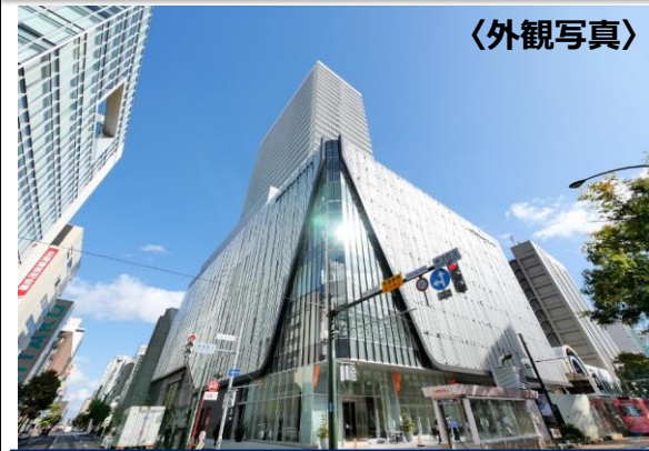
〈外観写真〉 〈住戸からの眺望〉