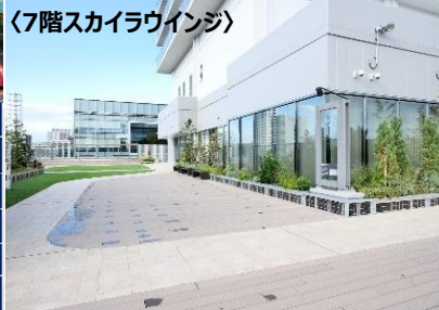
〈7階スカイラウンジ〉