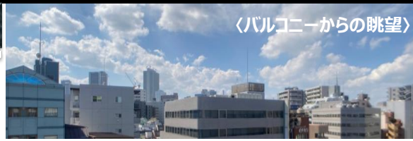
〈バルコニーからの眺望〉